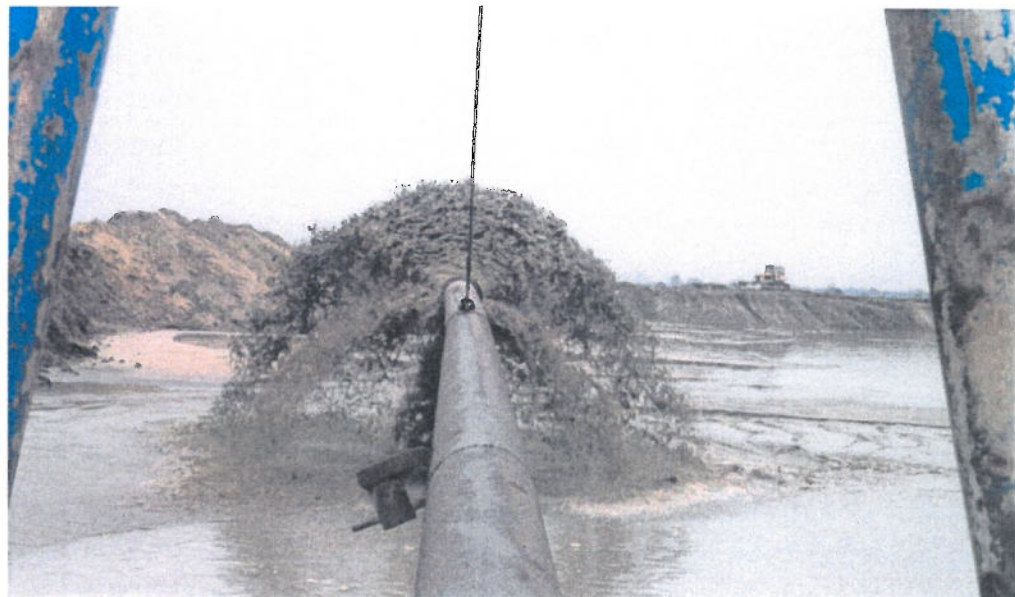
▲ Foto's boven: Links: de grote zandzuiger, de Vierlingsbeek, trekt een spoor van water door het Lindense land. 1995. Waar nog koeien staan is het nu water. Midden: de ontzanding gaat door, ook tijdens het bezoek van gedeputeerde Wersch in 1987. Rechts: Jo de Wit, streekarcheoloog mag met toestemming van Smals archeologisch onderzoek doen. ► Foto midden en rechts: beelden van de ontzanding